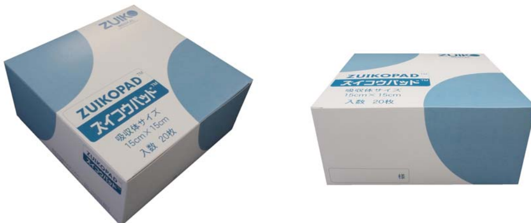
パッケージデザイン